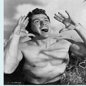
Tarzan'ın Sesi 'Aaaaaa...