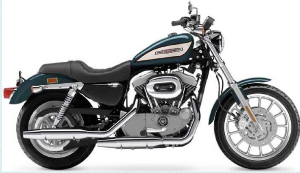
Harley Davidson Motor Sesi